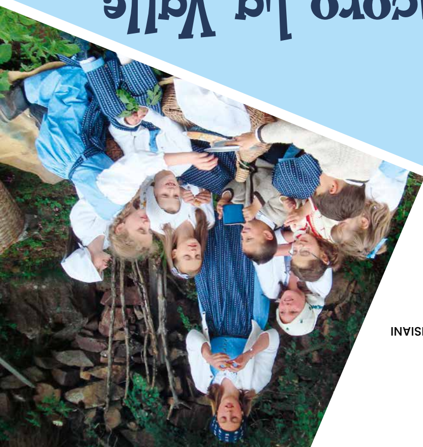
GRUPPO COSTUMI AVISIANI

divertirsi, incontrare nuovi amici, fare nuove esperienze attraverso musica e folklore